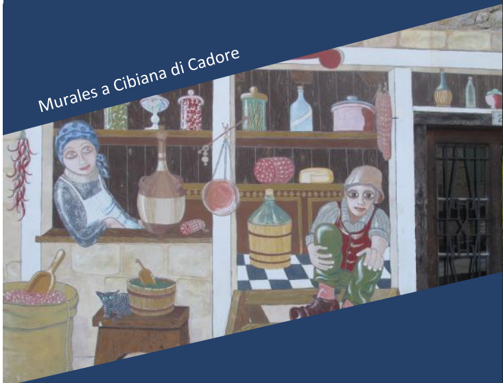
Murales a Cibiana di Cadore