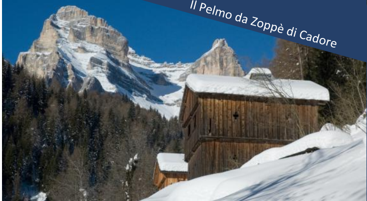
Il Pelmo da Zoppè di Cadore