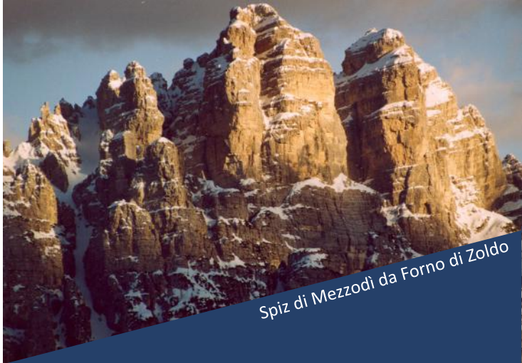
Spiz di Mezzodi da Forno di Zoldo