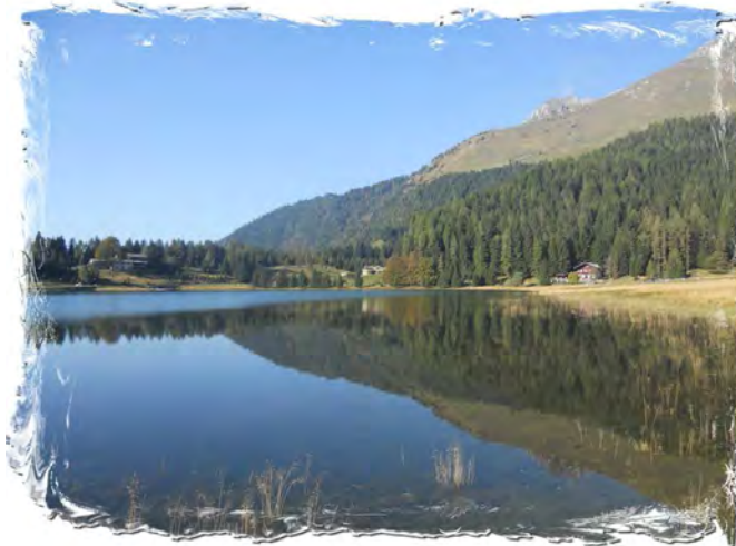
Lago di Lova - Borno (BS)