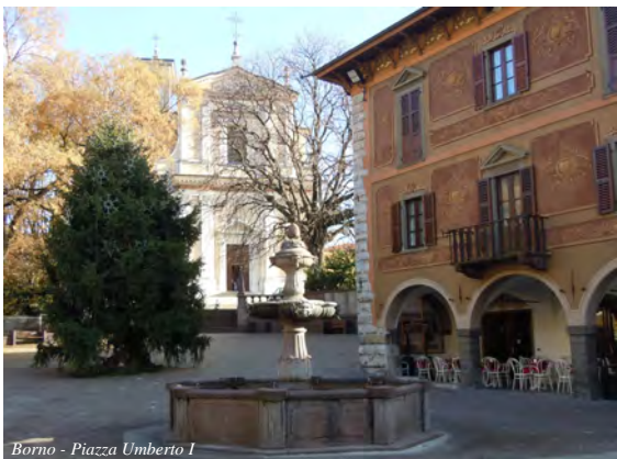
Borno - Piazza Umberto I

30 maggio: il CAI Lombardia chiama i "Seniores" a Borno!