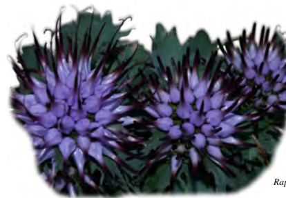
Raponzolo di roccia

Caratteristiche del percorso: itinerario ad anello che attraversa prati, boschi, ruscelli e pascoli alpini, camminando inizialmente su strada asfaltata, poi su stradine sterrate o sentieri che non raggiungono mai pendenze elevate. Panoramico e soleggiato.