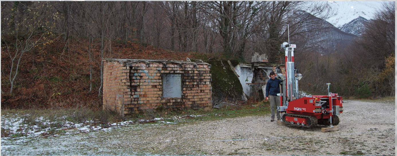
Sede Cai Castelli - Prima e dopo la realizzazione