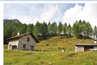
Rifugio Casera Val Binon